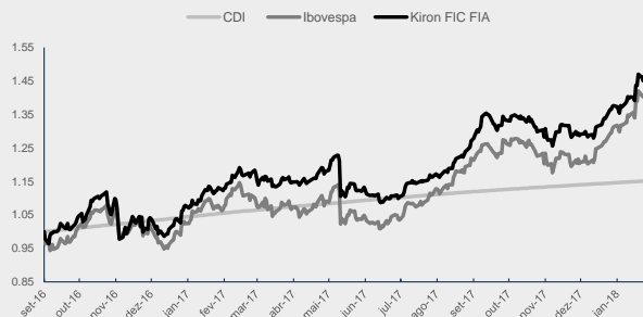
GRÁFICO DA PERFORMANCE

Obs: Histórico de rentabilidade em R$, líquido de taxas. Cálculo de volatilidade apenas para dias de pregão. *Início do fundo: 08/09/2016